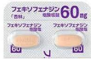
フェキソフェナジン